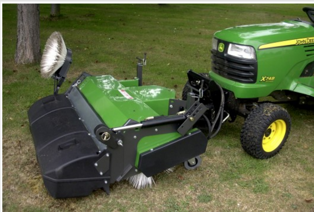
Brosse latérale à courroie