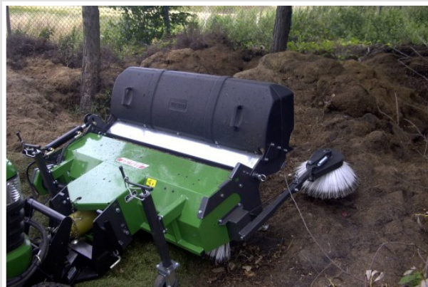
Bac de ramassage à vidage hydraulique