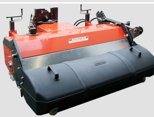
Bac de ramassage polyéthylène