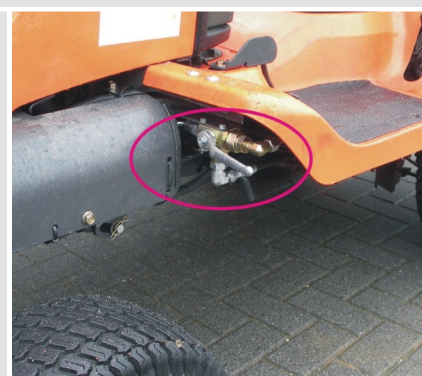
Vanne trois voies