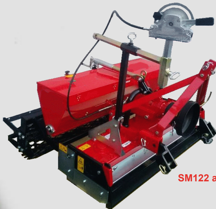
SM122 avec MTZ122