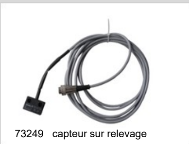
73249 capteur sur relevage