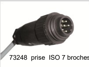
73248 prise ISO 7 broches

Câble supplémentaire de raccordement batterie (avec support)