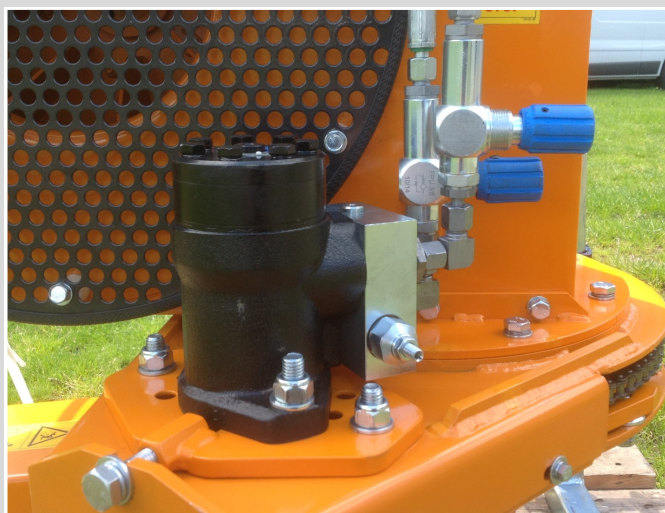
Sortie d'air orientable à 180° avec réglage de vitesse