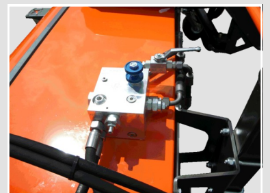
Bloc hydraulique et vanne d'arrêt