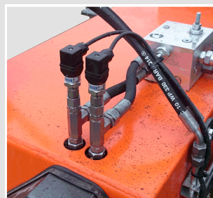
Capteurs de pression