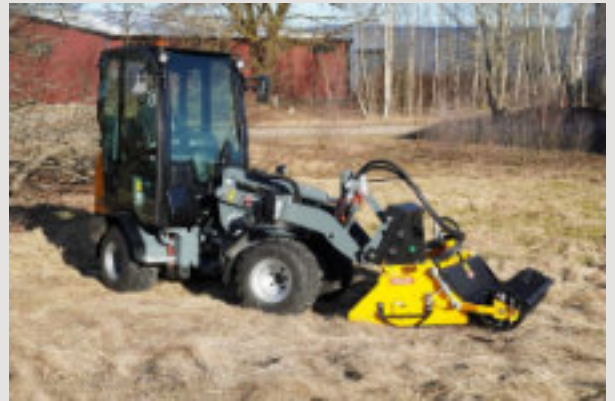
FISL sur chargeur GIANT