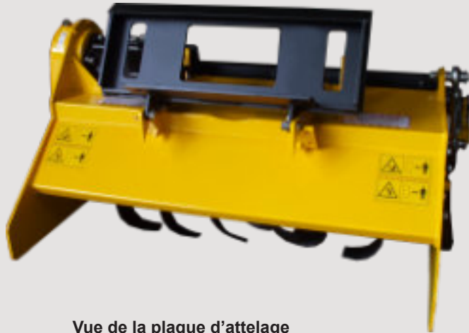
Vue de la plaque d'attelage