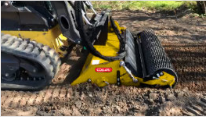
FISL avec rouleau grillagé