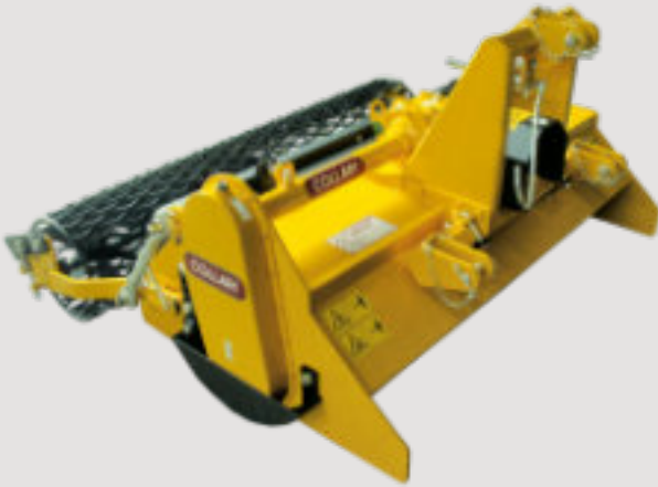
FISL avec rouleau grillagé