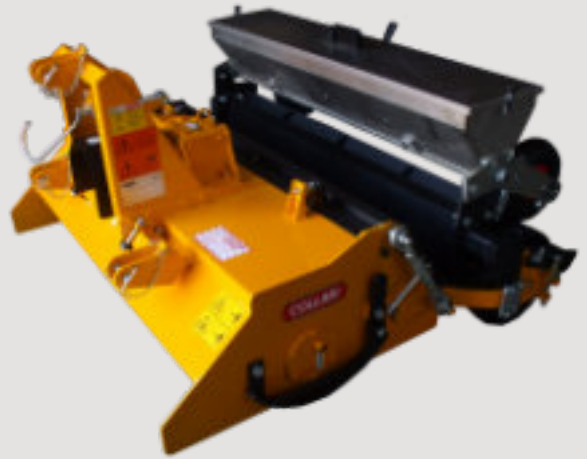
FISL avec rouleau grillagé et semoir