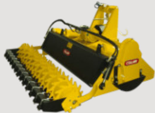
FISL avec rouleau packer et réglage hydraulique